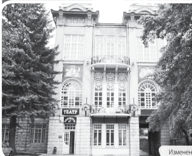
Изменения к лучшему объектов культуры