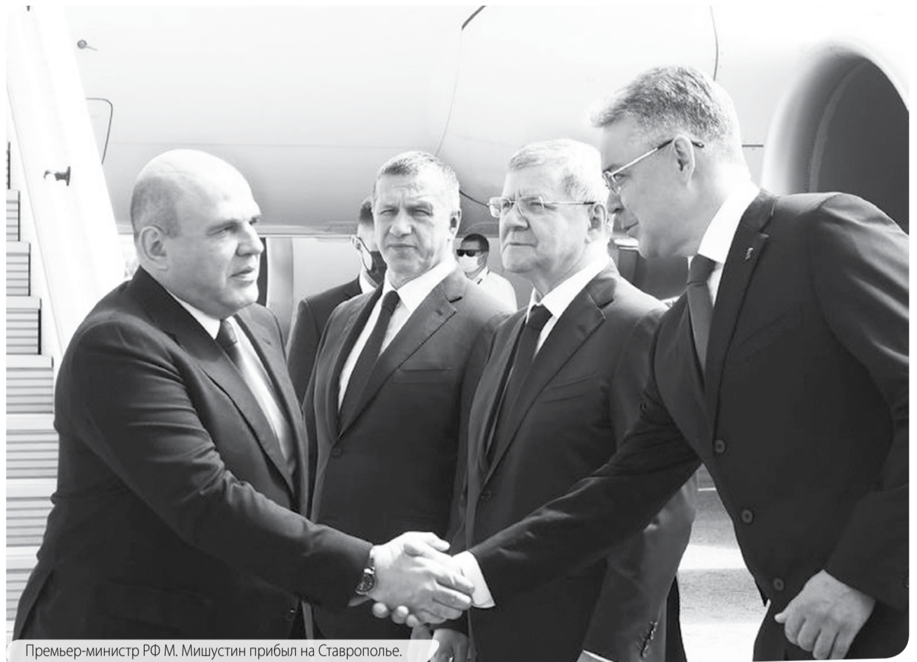
Премьер-министр РФ М. Мишустин прибыл на Ставрополье.

реализации мер по импортозамещению высокотехнологического обо-